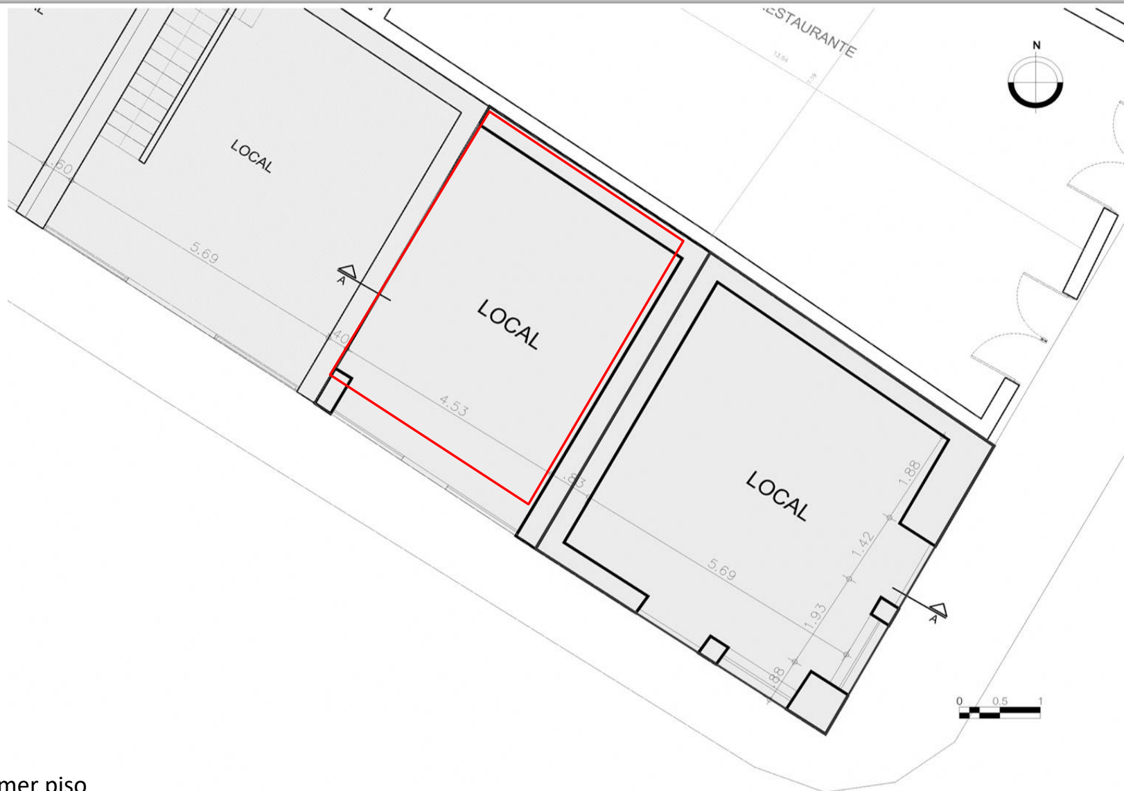
Planta primer piso